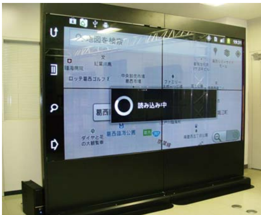
■280 インチ据え置き（カスタム事例）